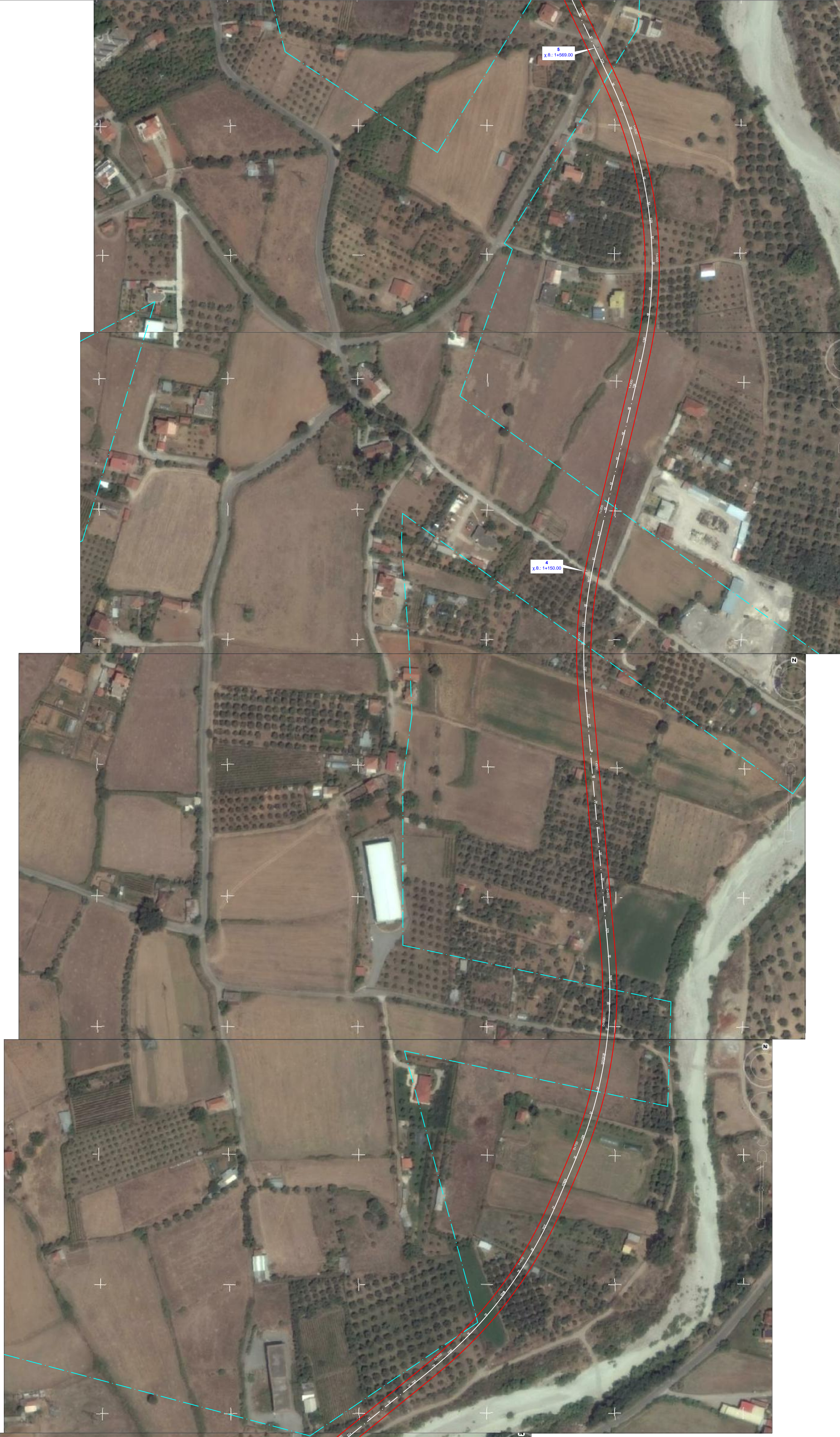
Θέση 1 - Καταβάνια Αθήνας